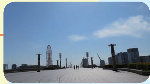
●シンボルプロムナード公園 青海、有明、台場の各エリアを結んで、臨海 副都心内の様々な施設をつないでいる公園。