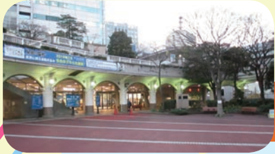
たけしほくせん 竹芝客船ターミナル・中央広場