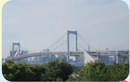
●レインボーブリッジ遊歩道 この遊歩道からかつて見たことのない 東京を眺めることができる。