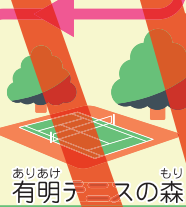
ありあけ 有明テニスの森